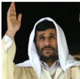
President Ahmadinejad