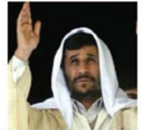
President Ahmadinejad