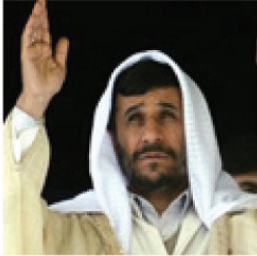
President Ahmadinejad