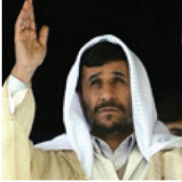
President Ahmadinejad