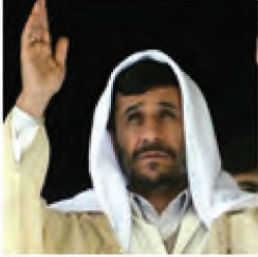
President Ahmadinejad