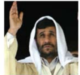
President Ahmadinejad