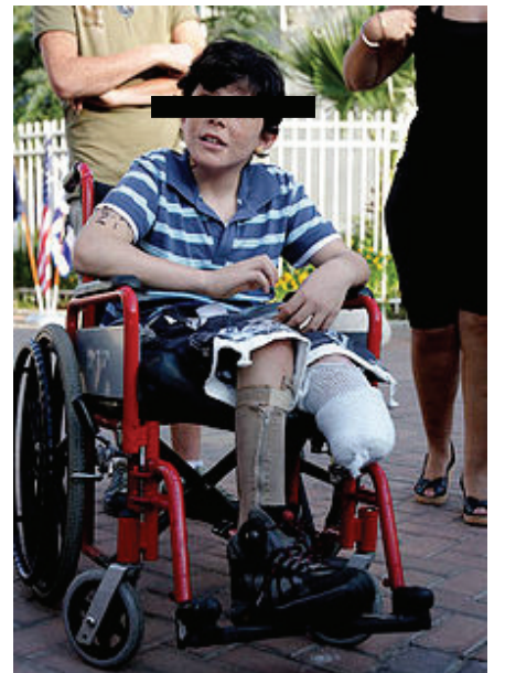
Israeli Jewish boy crippled by Palestinian rocket fire